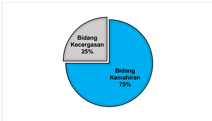
Rajah 2: Pemberatan Bidang Kemahiran dan Bidang Kecergasan

Fokus Kurikulum Standard Sekolah Rendah Pendidikan Jasmani Tahun Satu ialah membina kemahiran asas pergerakan dan kemahiran motor, memperkenalkan konsep kecergasan berdasarkan kesihatan dan memupuk elemen keselamatan, tanggungjawab sendiri dan interaksi sosial semasa melakukan aktiviti fizikal. Fokus Kurikulum Standard Sekolah Rendah Pendidikan Jasmani Tahun Satu diterjemahkan di dalam Bidang Kemahiran dan Bidang Kecergasan seperti Rajah 2. Kandungan kurikulum ini juga dibahagikan pemberatannya sebanyak 75% Bidang Kemahiran dan 25 % Bidang Kecergasan.